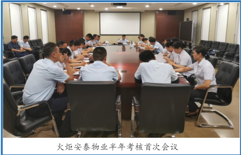
火炬安泰物业半年考核首次会议